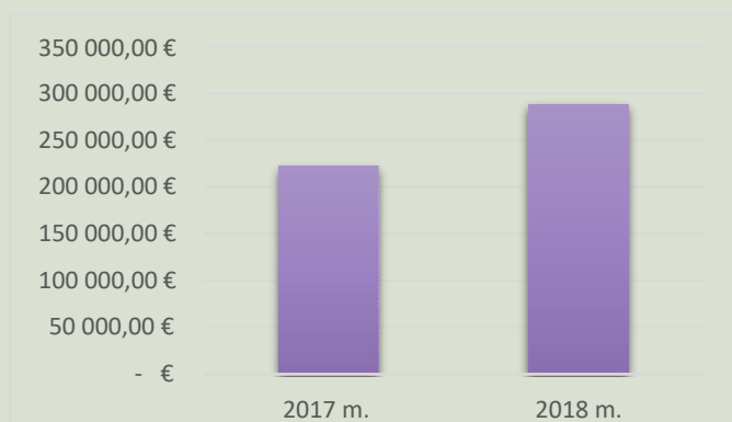
pav. 3 Surinktas atlyginimas 2017 m. ir 2018 m.

SURINKTAS ATLYGINIMAS. Surinktas atlyginimas, atskaičius Paskirstymo taisyklėse nurodytus atskaitymus - 287 668,27 € . Atlyginimas už retransliavimą kabelinių operatorių tinklais 2018 m. išaugo 29,4% .