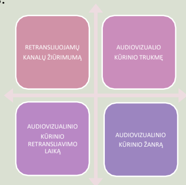
pav. 1 Atlyginimo skirstymo principai

Atlyginimas teisių turėtojams, išskyrus atlyginimą muzikinių klipų 1 teisių turėtojams, apskaičiuojamas remiantis: